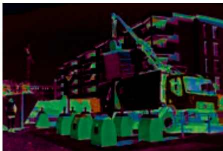
Des services à la collectivité et aux entreprises partout en Suisse romande.

Avec ses huit centres de tri et plateformes de transfert de déchets, Sogetri a développé ses compétences et son savoir-faire pour devenir le premier réseau de tri en Suisse romande. En plein essor, Sogetri prend en charge un très large éventail de déchets et regroupe les matières nobles, afin de