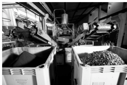
Une étape du recyclage des capsules: le marc de café est séparé de l'aluminium.

Pour le recyclage de l'aluminium, Nespresso travaille en étroite collaboration avec la coopérative IGORA, afin de proposer un éventail complet de services. D'abord, Nespresso fournit les conteneurs de collecte. Elle se charge aussi de l'enlèvement régulier du contenu, du nettoyage et du maintien en état des conteneurs. Pour ce faire, elle coopère étroitement avec des entreprises de récupération régionales. En outre, toutes les communes concernées sont informées des nouveautés et répertoriées sur les brochures de recyclage, ainsi que sur les sites Internet